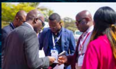
Le Business Matchmaking