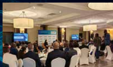
Le séances de réseautage